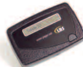
1-Kanal alphanumerischer Pager