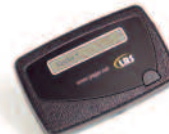
und 1-Kanal alphanumerischer Pager