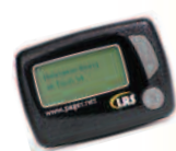
Multi-Kanal alphanumerischer Pager