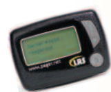
Multi-Kanal alphanumerischer Pager